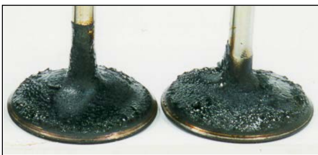
Sistema sem tratamento