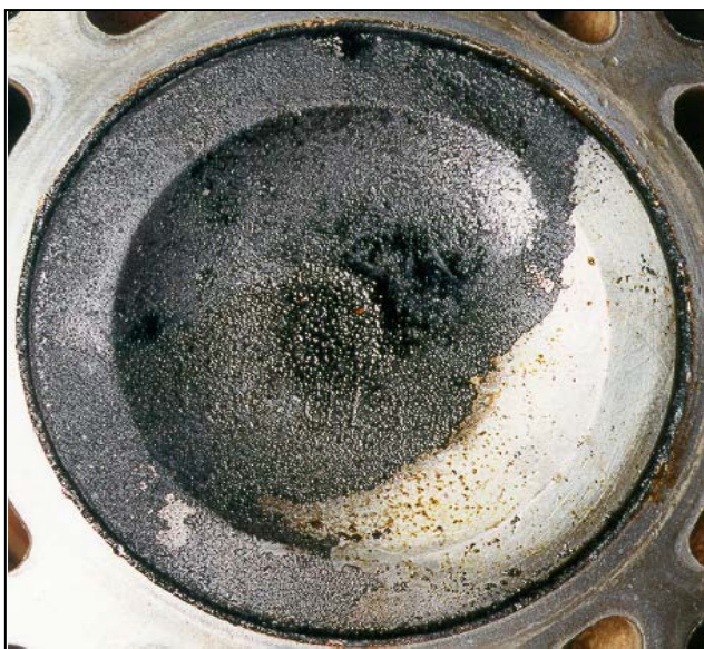
Sistema sem tratamento